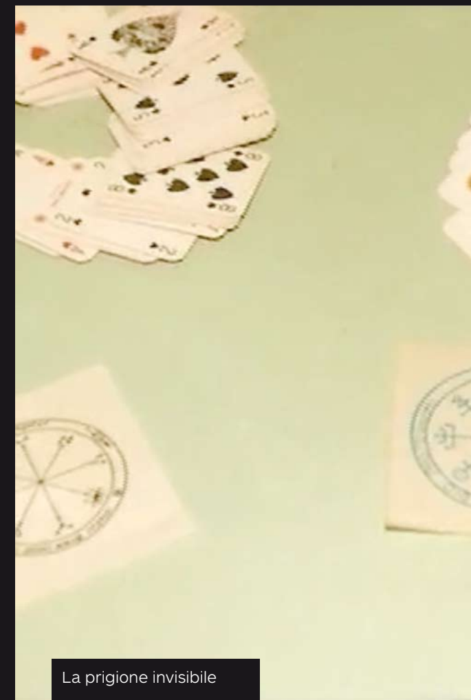
La prigioniera invisibile

Dalla scoperta dell'altro, dall'immigrazione e l'integrazione ( Il tempo delle arance ) alla cronaca di paesi e conflitti lontani, dal racconto della condizione femminile nelle diverse culture ( 1514. Le nuvole non si fermano; Didi - Bahini (Sorelle); Radio Sahar; The land of Jerry Cans. Il paese delle taniche ) all'ambiente ( Il suolo minacciato; Viaggetto sull'Appennino. A piedi da Piacenza a Rimini ). Dal ritratto di autori, artisti e personaggi famosi ( Maurizio Galimberti. The instant dada artist; Il pioniere del wireless: Guglielmo Marconi 1874-1937 ), al racconto della storia d'Italia e della provincia ( Casermes Rosse. Il lager di Bologna; Memory. Fughe dalla democrazia; Note a margine. Appunti per un film sul sette luglio; Isola delle Rose. La libertà fa paura; Buio in sala ), costruendo interessanti spaccati della nostra società tra cronaca e inchiesta, facendo emergere aspetti inconsueti ( Ci provo; È stato morto un ragazzo. Federico Aldrovandi che una notte incontrò la polizia; La mia casa è la tua. Volti e momenti dal mondo dell'accogliere; Occupiamo l'Emilia; La prigioniera invisibile; Raunch girl; Il valzer dello Zecchino. Viaggio in Italia a tre tempi; Sorelle d'Italia ) per un viaggio instancabile nel nostro territorio.